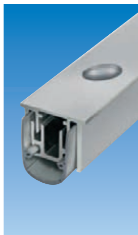
Планет RS с отверстием Планет Ø10,8 мм и 5×13 мм. Смотри раздел Кромочная задвижка | Отверстие