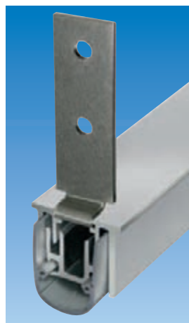
Наилучшая длина уплотнителя с изогнутым уголком 4 мм