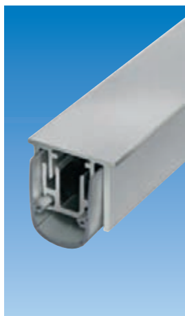
Уплотнитель Планет RS