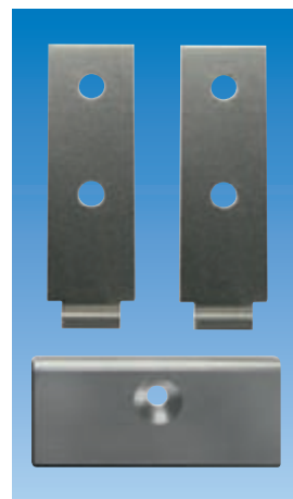
Пример: Крепёжный уголок ВЕКА вкл. упорную пластинку, вид 10 из крепёжного набора RS / вид ВЕКА