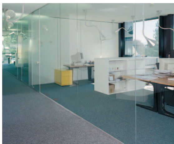
Планет KG в цельностеклянных дверях и стеклянных перегородках