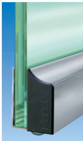
Планет KG-A8 | A10 с заглушкой