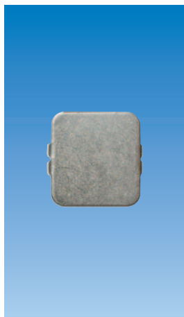
Упорной пластинкой вид 1