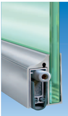
Планет KG-A8 | A10, надет и приклеен